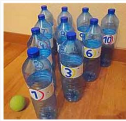
"Juego de bolos"